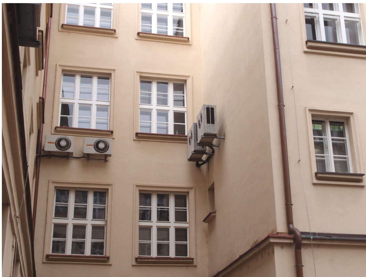
Obr. 9: Klimatizační jednotka venkovní Hitachi –2x split, 2x RAC-2253