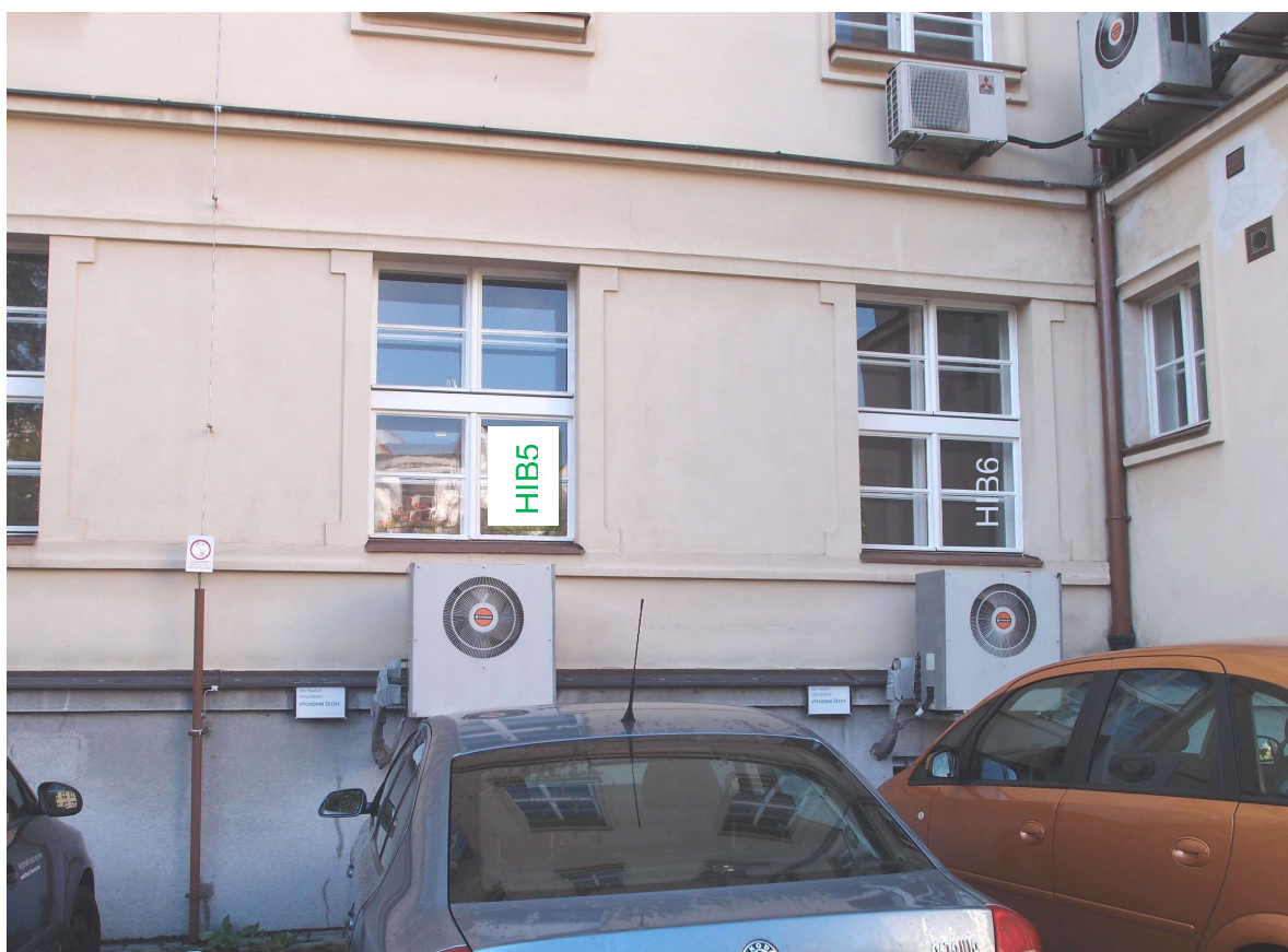
Obr. 7: Klimatizační jednotka venkovní Hitachi - RAC-2253 – systém HIB6, HIB5