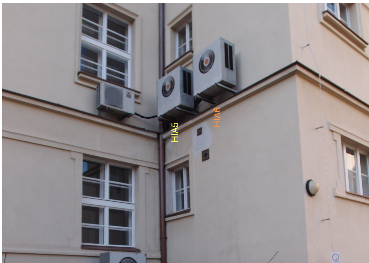
Obr. 6: Klimatizační jednotka venkovní Hitachi - RAC-2253 – systém HIA6, HIA5, HIB6