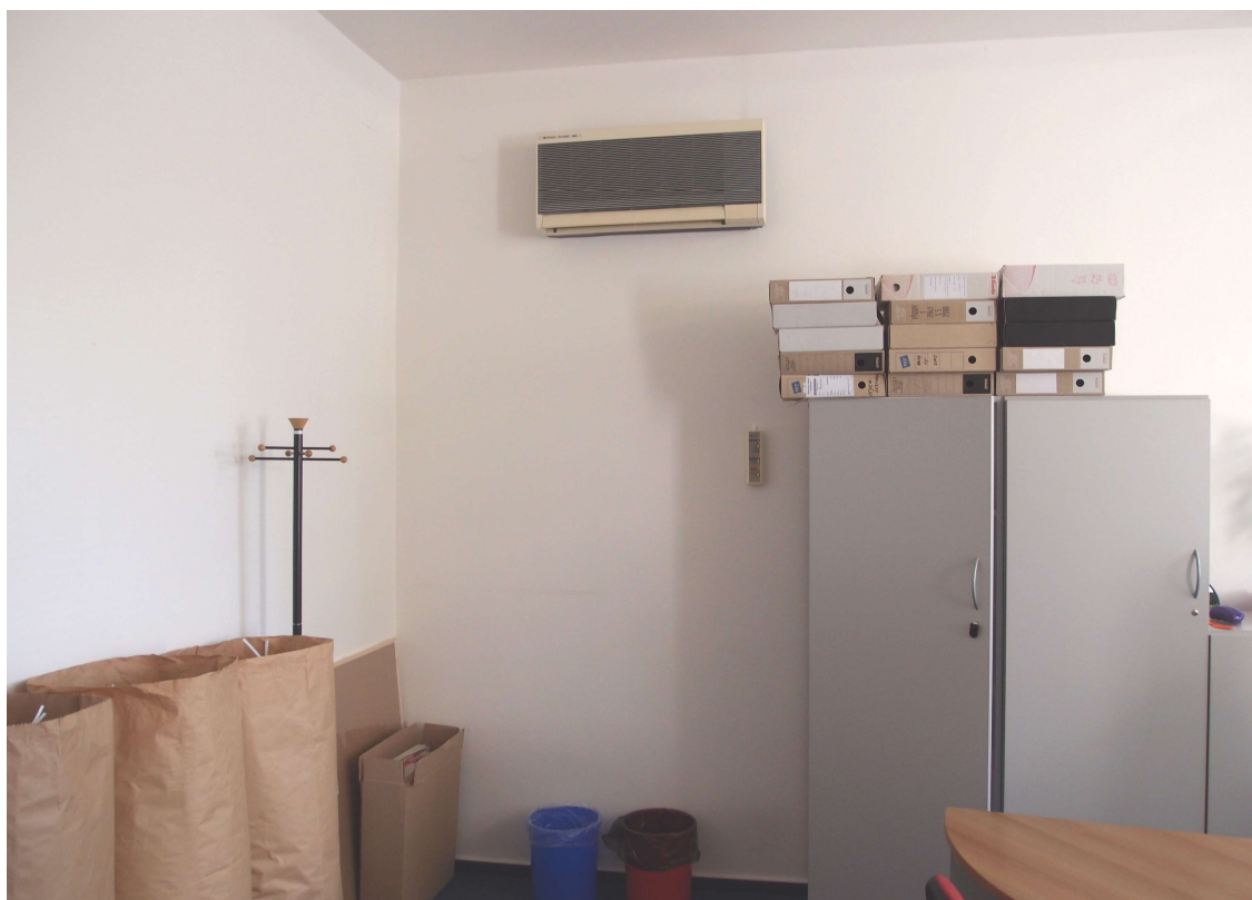
Obr. 2: Klimatizační nástěnná jednotka Hitachi - RAS-2103GWX - nosná stěna