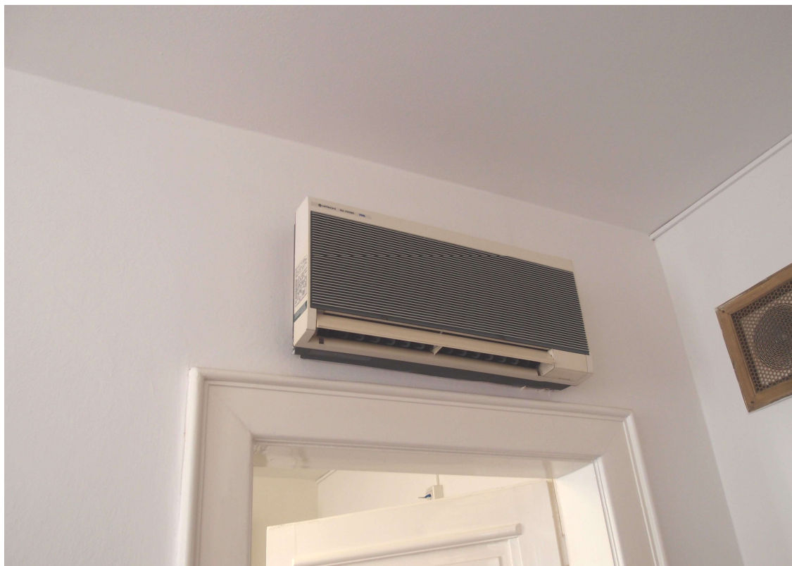
Obr. 1: Klimatizační nástěnná jednotka Hitachi - RAS-2103GWX nad dveřmi – příčka