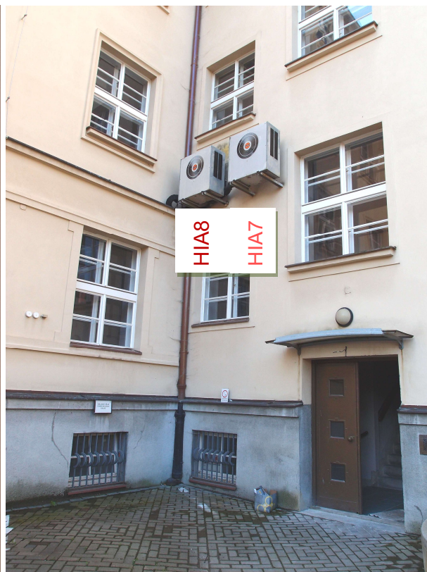
Obr. 4: Klimatizační jednotka venkovní Hitachi - RAC-2253 – systém HIA7, HIA8