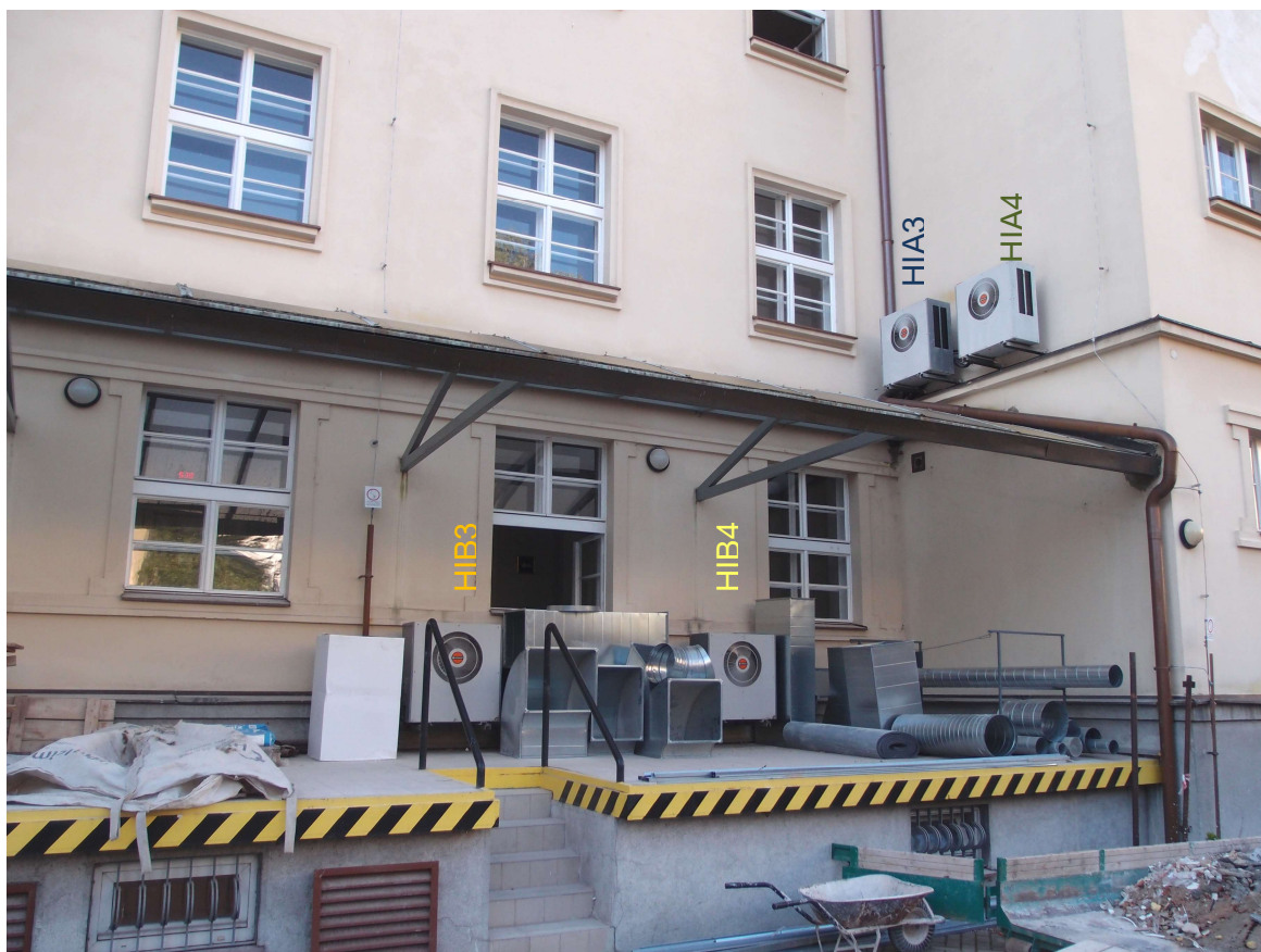
Obr. 8: Klimatizační jednotka venkovní Hitachi - RAC-2253 – systém HIA4, HIA3, HIB4, HIB3