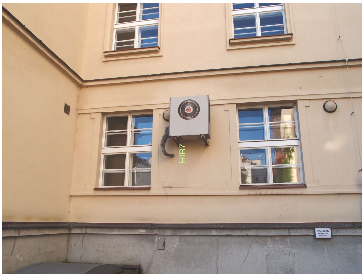
Obr. 5: Klimatizační jednotka venkovní Hitachi - RAC-2253 – systém HIB7